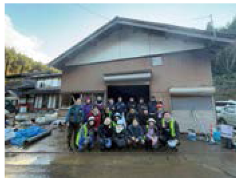
(能登災害復興ボランティア参加時のもの)