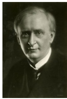
アーサー・シェルドン (ベンジャミン・コリンズ)